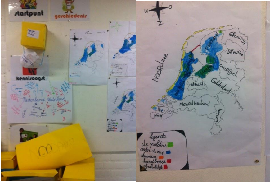
Welke provincies liggen grotendeels onder N.A.P.?

En met zulke goede kaarten kunnen we dat weer aan de studievvaardigheden werken: